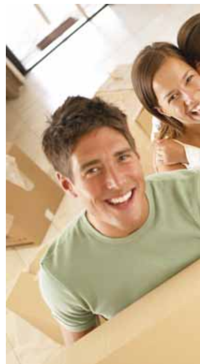
Die Umzugskisten sind gepackt. We... niedrigen Hypothekenzinsen. Foto:

Der Kauf oder Bau einer eigenen Immobilie lässt sich derzeit noch immer außergewöhnlich günstig finanzieren. Die niedrigen Hypothekenzinsen sind geradezu eine Steilvorlage für alle, die auf die eigenen vier Wände setzen wollen. Schließlich steht das eigene Heim für Sicherheit, Beständigkeit und einen sorglosen Ruhestand. Auch Vater Staat, Länder und Gemeinden fördern Häuslebauer vor allem beim energieeffizienten Bauen nach Kräften. Dabei kommt Erwerb von