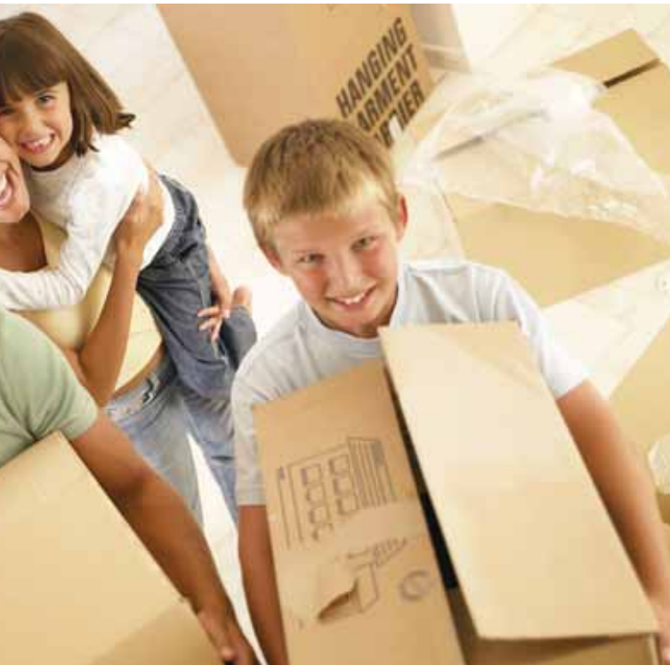
er jetzt baut, profitiert von noch immer außergewöhnlich

solide Finanzierung. Jeder angehende Bauherr sollte gründlich prüfen und sich beraten lassen, welche Raten er monatlich verkraften kann. Denn auch in der Niedrigzinsphase gehen Häuslebauer und Immobilienkäufer große Risiken ein, im Normalfall verschulden sie sich über Jahre hinweg mit hohen Summen.