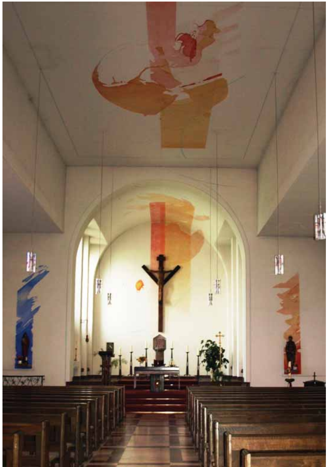
Moderne Farbgebung wird die Lippetaler Passion in der Hovestädter Kirche begleiten.

Insgesamt werden für Chor und Darsteller mehr als 100 Mitwirkende benötigt, wobei Chormitglieder auch als Darsteller aktiv werden sollen. Neben den Rollen Jesus Christus, Maria, Judas, Pontius Pilatus, Satan und Petrus setzen weitere Apostel, Pharisäer, Knechte, Engel, ein Hauptmann mit vier Soldaten, Simon der Kanaanäer, Engel, Volkesstimmen, Chormitglieder und Schriftgelehr-