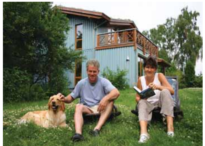
Der Traum von den eigenen vier Wänden lässt sich derzeit immer noch zu günstigen Konditionen erfüllen.

enz und Komfort fürs Alter sind besonders wichtig, daher sollte eine vorausschauende Planung auch die richtige Wahl des Architekten sowie der Handwerker umfassen. Sie helfen, Kosten zu senken und Flexibilität für die Zukunft zu sichern. Denn im Vordergrund steht das Grundbedürfnis der Menschen, sich aus dem Mietdilemma zu befreien und in den eigenen vier Wänden Sicherheit und Geborgenheit zu finden.