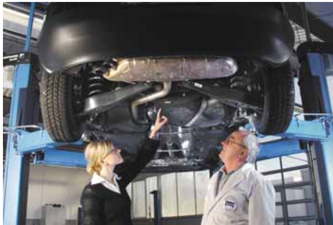
Der Fachmann im Meisterbetrieb weiß, wo der Winter seine Spuren am Fahrzeug hinterlassen hat.

Neben dem Unterboden und dem Auspuff nimmt der Kfz-Meisterbetrieb alle sicher-