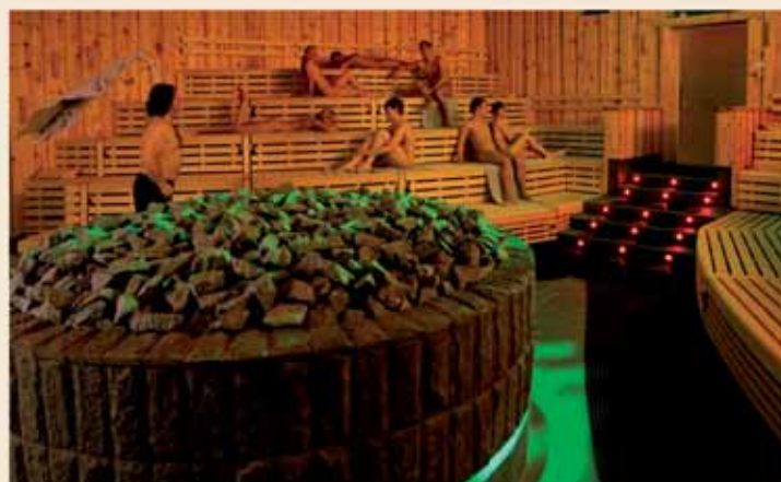
Multimedia-Sauna ArenaMare 90°C

Sauna erleben ist vor allem in unseren MaxSaunaNächten angesagt. Diese finden jeden ersten Freitag im Monat von 20-1 Uhr statt – ohne Aufpreis! Diese Mottoabende werden auch in die Aufguss-Szenarien integriert – pure Saunafreude für unsere Saunafreunde.