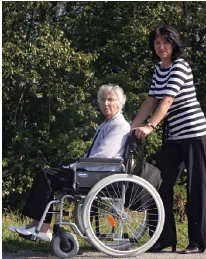
Pflege und Alter: Immer mehr Bürger müssen sich damit beschäftigen. Die Hilfsangebote für ein selbstbestimmtes Leben in der eigenen Wohnung nehmen aber zu.

Vorbereitet ist auf eine solche Situation kaum jemand. Manchmal baut ein alter Mensch zwar allmählich ab - der Eintritt des Pflegefalls und der Verlust der Selbstständigkeit kommen dann in den meisten Fällen trotzdem überraschend. Oftmals aber tritt der Pflegefall aber auch aus heiterem Himmel ein, beispielsweise nach einem Schlaganfall, einem Herzinfarkt oder einem Sturz. Die Angehörigen müssen nun unter großem Zeitdruck wichtige und plötzliche Entscheidungen treffen. Besser ist es, sich auf eine solche Situation einzustellen und entsprechende Vorbereitungen zu treffen. Wer auf der Suche nach einem guten ambulanten Pflegedienst für die Pfl-