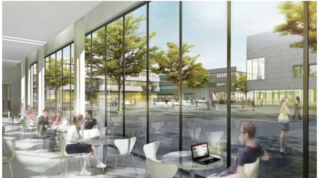
So soll sie einmal aussehen: Die neue Hochschule in Lippstadt, hier in einer Projektstudie. Bild-von-Rhode-Kellermann-Wawrowsky-Duesseldorf.

Eines der Ziele der Hochschule ist, die noch immer geringe Anzahl an Frauen, die sich für ein ingenieurwissenschaftliches Studium entscheiden, zu erhöhen. In Lippstadt, auf dem zentralen und dennoch grün gelegenen Gelände, dem so genannten