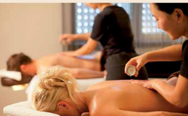
Neu "Kraft des Lichts" (Massagekerze)

Im Wellness Resort können Sie sich fallen lassen; zu Zweit bei Paaranwendungen oder bei Wellness mit Freunden (ab acht Personen). Darüber hinaus bieten unsere chinesischen Gesundheitsmasseurinnen Traditionelle China-Massagen an. Von der Kaiserlichen- bis hin zur Shanghai-Ömassage.